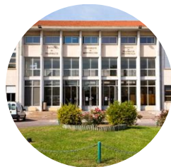
PASS Flahault Av. Charles Flahault MONTPELLIER