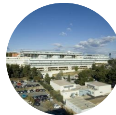
PASS Nîmes Ch. Du Carreau de Lanes NÎMES

Des enseignements communs (en présentiel et en visio)