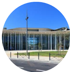
PASS Arnaud de Villeneuve (ADV) Av. du Doyen Giraud MONTPELLIER