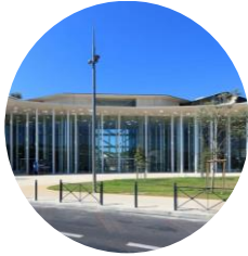
PASS Arnaud de Villeneuve (ADV)