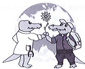
Crocos du Monde