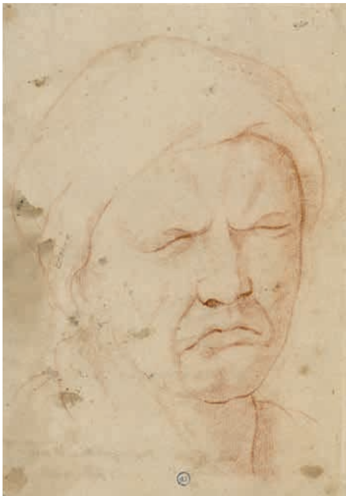
D'après Charles Le Brun, Le pleurer , XVIII e siècle, sanguine sur papier vergé, Montpellier, musée Fabre, 870.1.460