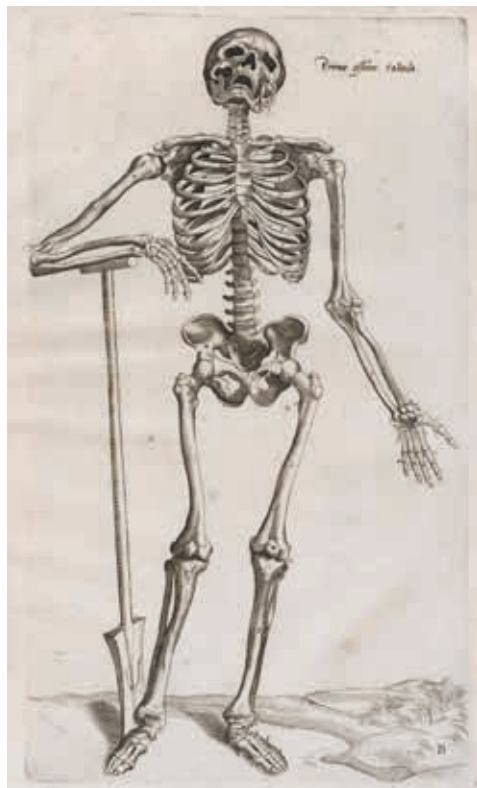
André Vésale, De humani corporis fabrica libri septem , planche d'illustration, 1555, ouvrage, Montpellier, Université de Montpellier, Bibliothèque universitaire historique de médecine, Eb 87 in-fol