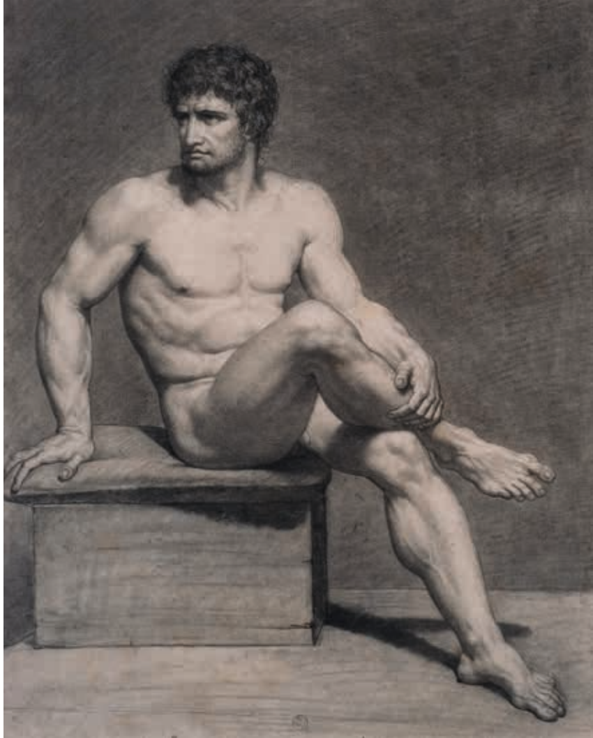
François-Xavier Fabre, Académie : homme assis , XIX e siècle, pierre noire, Montpellier, Université de Montpellier, musée Atger, MA 276. Classé au titre des monuments historiques le 25 janvier 1913