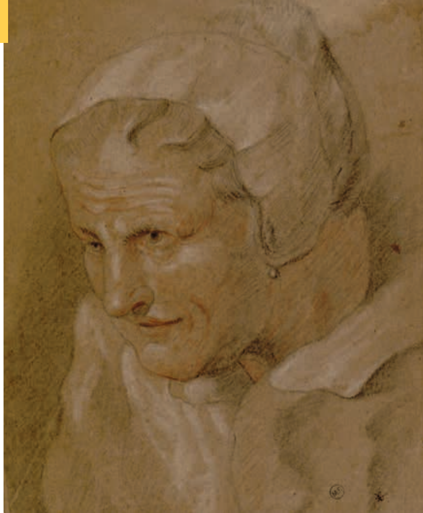
D'après Pieter Paul Rubens, Portrait de vieille femme , XVII e siècle, sanguine, rehauts de craie blanche, sur papier bleu, Montpellier, musée Fabre, 870.1.285

Pendant l'exposition, le musée Atger est ouvert du lundi au samedi de 13h30 à 17h30. Entrée libre.