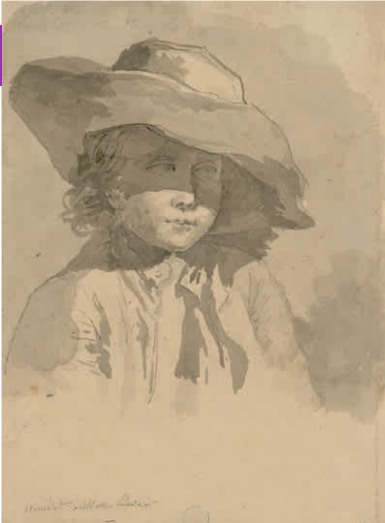
Couverture : entourage de Giovanni Battista Piazzetta, Tête de jeune femme , XVIII e siècle, pierre noire et estompe, rehauts de craie blanche sur papier blanc, Montpellier, musée Fabre, 864.2.174