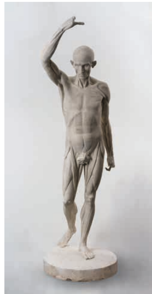
Jean-Antoine Houdon, Le grand Écorché, vers 1779, moulage en plâtre, Montpellier, musée Fabre, 806.32

Situé au cœur de l'enseignement, l'étude de l'anatomie est particulièrement décelable dans les œuvres des jeunes artistes. Les dessins sont bientôt suivis par des tableaux de grand format, comme ceux de Jacques Louis David ou François-Xavier Fabre, où les sujets peignent à cacher le statut d'exercice. Les morceaux de réception à l'Académie valorisent très souvent des personnages à la musculature parfaitement représentée. Il se dessine à travers ces pratiques une conception presque scientifique de l'art, témoignage étonnant d'une époque où l'on pensait que le beau pouvait s'enseigner.