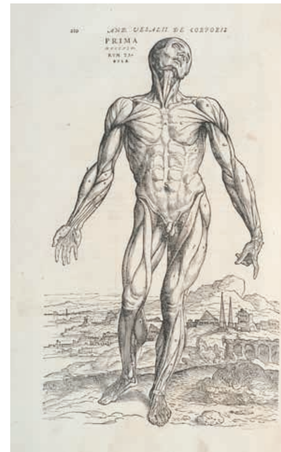
André Vésale, De humani corporis fabrica libri septem, planche d'illustration, 1555, ouvrage, Montpellier, Université de Montpellier, Bibliothèque universitaire historique de médecine, Eb 87 in-fol