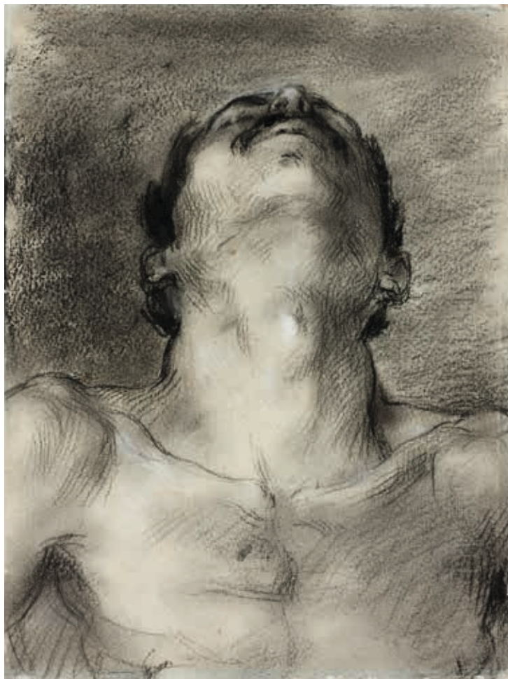
Jean-Baptiste Carpeaux, Tête d'homme levée vers le ciel , XIX e siècle, dessin au fusain, rehauts de blanc, Montpellier, musée Fabre, D6.5.8