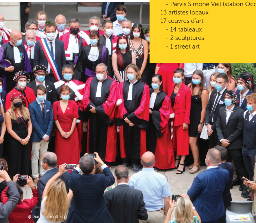
Cérémonie des 800 ans, Faculté de médecine de l'Université de Montpellier