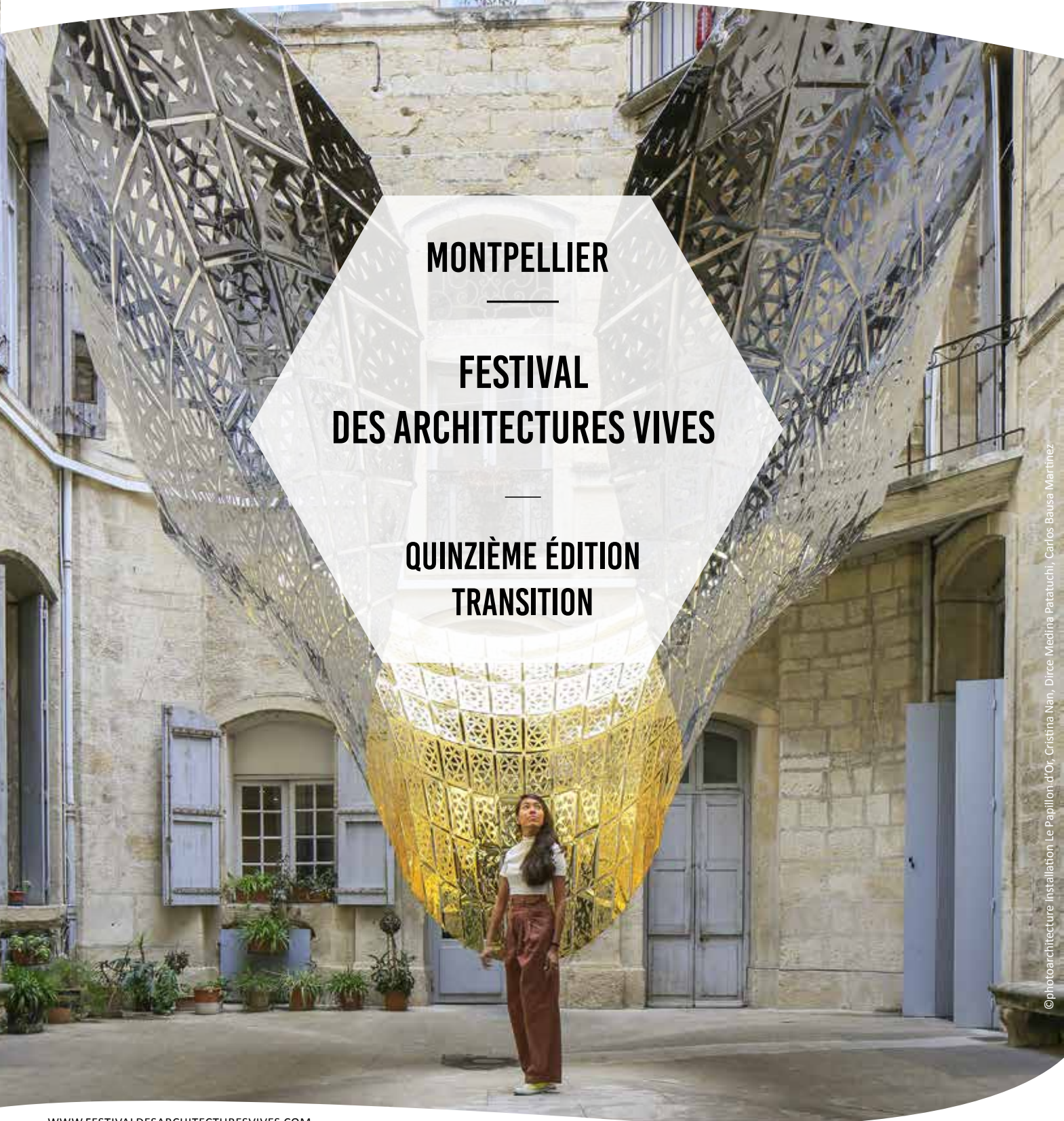
©photoarchitecture - Installation Le Papillon d'Or, Cristina Nan, Dirce Medina Patatuchi, Carlos Bause Martnez

9H - 19H / ENTRÉE LIBRE POUR LE SITE DE LA FACULTÉ DE MÉDECINE